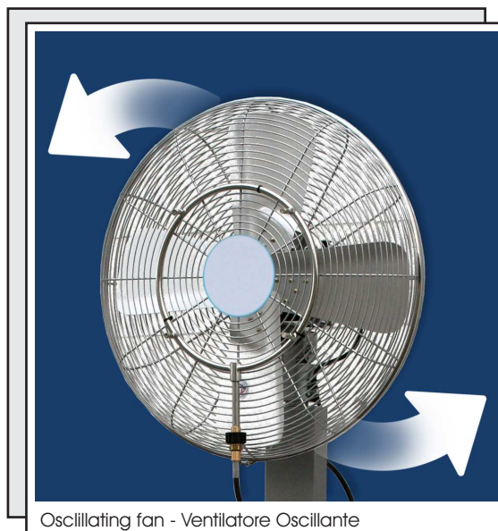
Oscillating fan - Ventilatore Oscillante

Finally! Enjoy a cool summer also outdoor and without fixed installations. MOBI-COOL is really a special fan, quiet, effective, fully autonomous with a high capacity water tank that guarantees from 3 up to 5 hours of autonomy. MOBI-COOL is quiet, its electrical QES motor and pump are noiseless, less than 55 DB noise emission, thanks to a low consumption technology designed for applications in environments requiring low noise emissions.